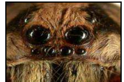
Les 8 yeux de la mygale.

Pour se défendre, la mygale a le corps recouvert de poils urticants, comme certaines chenilles. Si un prédateur essaye de la manger, cela le démange tellement qu'il peut décider de renoncer. Les mygales sont ovipares*. La femelle dépose ses œufs dans un cocon qu'elle déplace entre ses pattes.