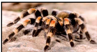
Cette espèce s'appelle la mygale de Smith.

assez peu de morsures de mygales sont dangereuses pour l'homme.