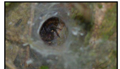
Une mygale dans son refuge.

plupart du temps des insectes et des petites grenouilles ou lézards. Les plus grosses mygales peuvent aussi se nourrir de petits rongeurs ou d'oiseaux. Contrairement