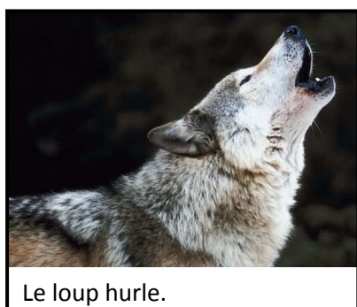
Le loup hurle.

Le loup est un carnivore* qui se nourrit de d'oiseaux, de lapins, de petits rongeurs, voire de moutons, de cerfs et