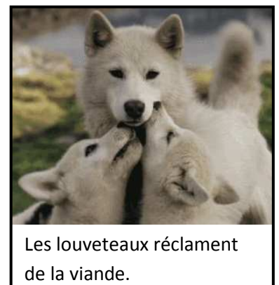
Les louveteaux réclament de la viande.