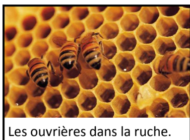
Les ouvrières dans la ruche.

Pour se défendre, les abeilles possèdent un dard qui sert à piquer. Contrairement aux guêpes, les dards des abeilles se détachent quand elles piquent. Elles ne peuvent donc piquer qu'une seule fois et meurent peu de temps après.