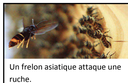
Un frelon asiatique attaque une ruche.

indiquer aux autres abeilles où se trouvent les fleurs à butiner.