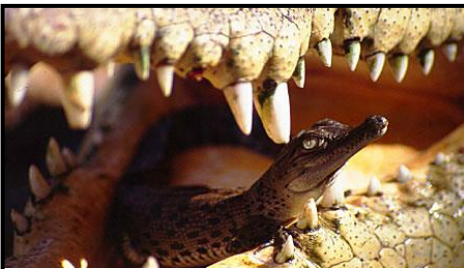
Un parent transporte son petit dans sa gueule.

Ils se nourrissent d'animaux qui viennent boire à la rivière, ils les capturent grâce à leurs puissantes mâchoires et les entraînent au fond de l'eau afin de les noyer.