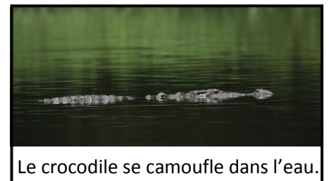
Le crocodile se camoufle dans l'eau.

les autres crocodiles pour les aider à chasser, bien qu'ils cohabitent dans les mêmes plans d'eau.