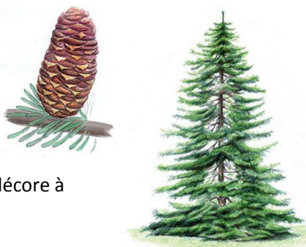
Le Sapin de Nordmann