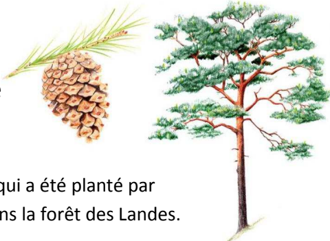
Le Pin Sylvestre

C'est le pin qui a été planté par l'homme dans la forêt des Landes.